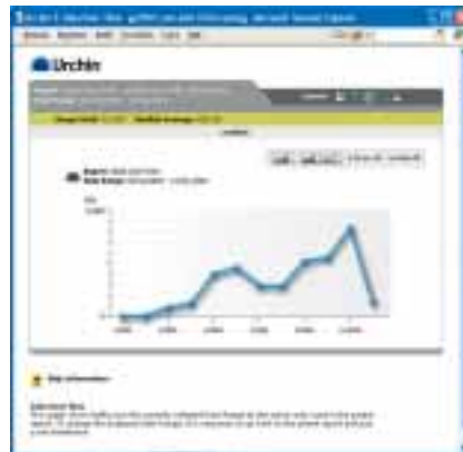
Urchins webstatistieken laat zien dat MSNbot gedurende 2004 steeds vaker langskwam.

Op basis van de zoekmachineverzadiging meet u welk deel van uw webpagina's is opgenomen in de databases van de zoekmachines. Hebt u bijvoorbeeld een website met honderd webpagina's en tien daarvan zijn geïndexeerd door de zoekmachine in kwestie, dan spreken we van een zoekmachineverzadiging van 10 procent. Dit cijfer is een direct gevolg van de rol die de indexatiecomponent van de site speelt en de mate waarin u zoekrobots naar uw site trekt. Op www.market