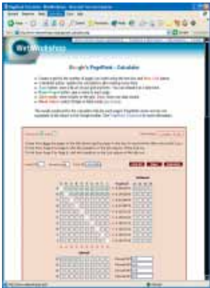
De PageRank-calculator op www.webworkshop.net/pagerank_calculator.php laat zien hoe uw site-architectuur van invloed is op uw interne pagerank.