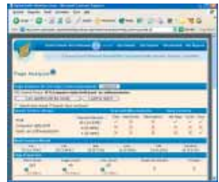
Met de PageAnalyzer van OptimizeKit.com kunt u uw webpagina analyseren op meer dan 60 punten.

Online vindt u een aantal goede toolkits. Naast Submit-it van Microsoft noemen we OptimizeKit.com. Hiermee optimaliseert u stapsgewijs uw website op alle dergenoemde punten en meer. Zoek ook eens in de zoekmachines naar 'SEO tools' of iets dergelijks. Of bezoek de website www.searchmarketing.nl voor een lijst met tools. <