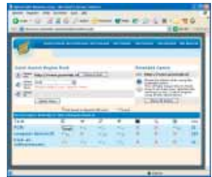
Met deze software van optimizekit.com kunt u ook onderzoeken welke zoektermen mensen veel gebruiken om naar uw producten of diensten te zoeken.

Uitgebreide toolkits als WebPosition Gold, WebCEO en Trellian SEO Toolkit zijn softwarepakketten die u kunt gebruiken. Google raadt echter het gebruik van dit soort pakketten af. De goede pakketten maken gebruik van de Google API. Registreert u zich hiervoor, dan mag u dagelijks duizend zoekbewerkingen doen via dergelijke software.