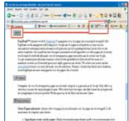
Alleen bladzijden met een Pagerank van vier of hoger tellen mee voor uw eigen PageRank.